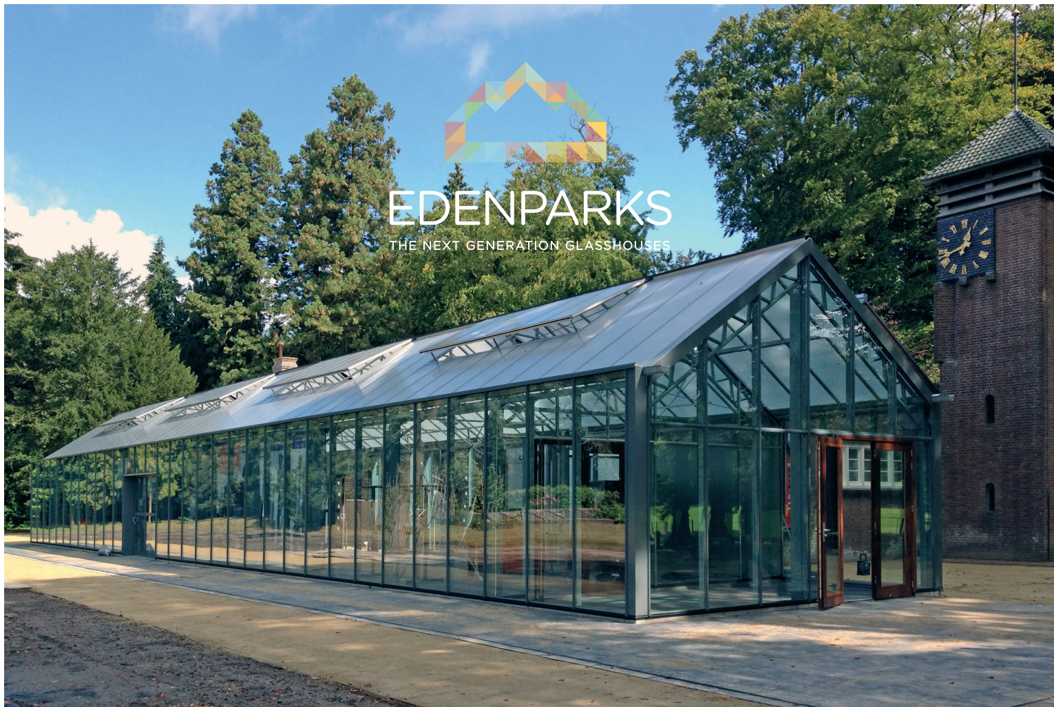
Huis Doorn | Kas aan garage